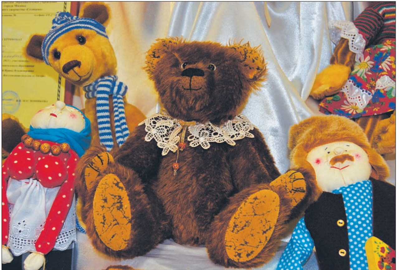
Мишки один симпатичнее другого