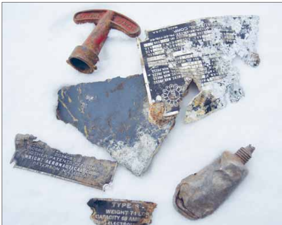
■ Это всё, что осталось от «Бостона»